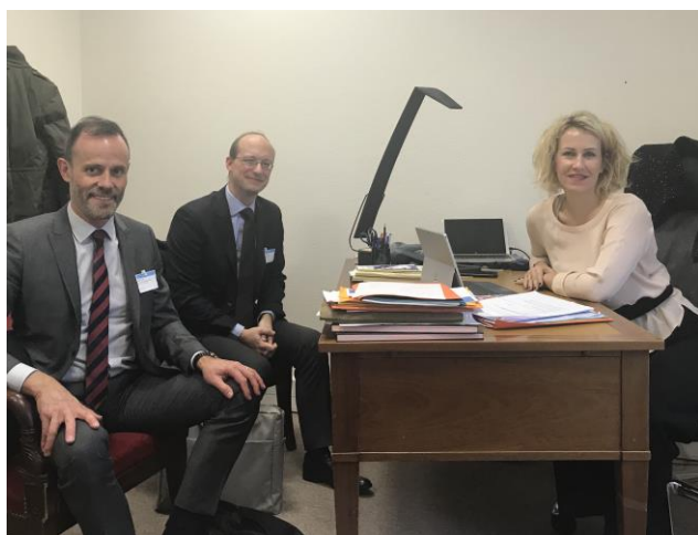
5/12 rencontre avec le directeur de la production hydroélectrique d'EDF à Paris

bertrand.biju-duval@clb-an.fr / 06 37 53 75 17 / 04 76 88 88 35